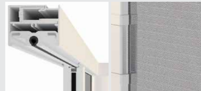
Top Track H: 38mm W: 48mm Discreet Handle