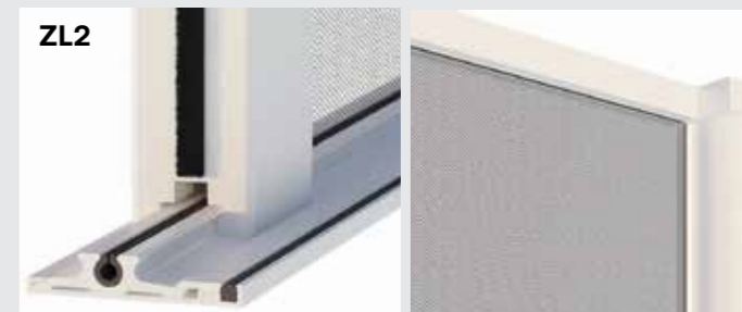
Bottom Track H: 12.5mm W: 63mm Concealed Fixings