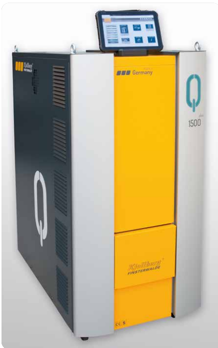
Q-Source mit Q-Desk: Plasmaströmquelle mit Human Machine Interface Q-Source with Q-Desk: Plasma power source with human machine interface

Einsetzbar für die gesamte Anlagenreihe | Can be used for the entire series