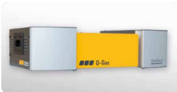
Q-Gas: automatische Plasma-Allgaskonsole Q-Gas: Automatic plasma all-gas console

Einsetzbar für die gesamte Anlagenreihe | Can be used for the entire series