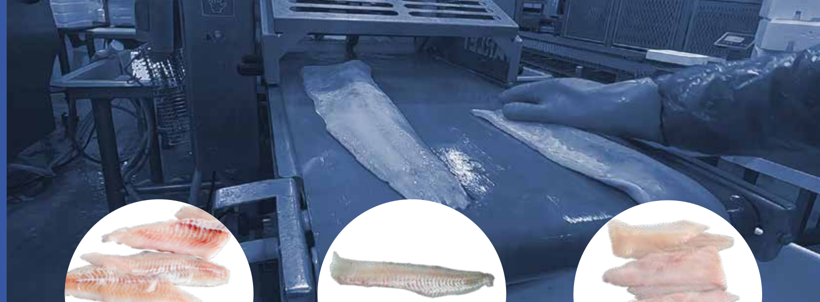
Pelage brillant (loup de mer et cabillaud)

Les machines V1588S, V1588 et V1688 sont des peleuses compactes monopiste ou double piste, dédiées aux filets de poisson blanc à peau fine, petits et moyens. Elles sont conçues pour optimiser le brillant et le rendement, grâce aux plaques à brillant qui se placent au niveau du rouleau presseur (brevet Varlet) pour maintenir le filet et le guider. Ces machines sont également adaptées pour le pelage traditionnel et profond. Elles disposent de 2 rouleaux presseur pour peler 2 filets en même temps, ou d'un seul rouleau presseur pour être utilisées comme des peleuses monopistes.