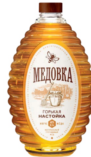
0,5 L / 40%

Prepared according to a traditional Russian recipe based on natural honey.