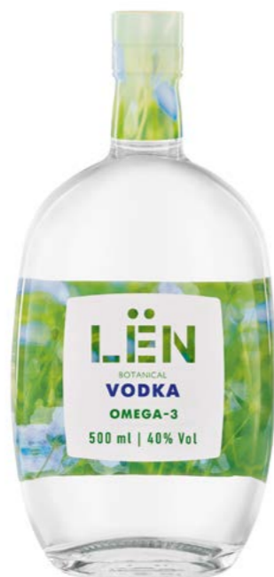
ОМЕГА-3 0,5 L / 40%

Has an extraordinary softness with vegetable notes in the aroma.