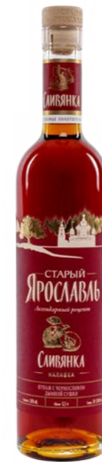
СЛИВЯНКА / SLIVYANKA 0,5 L / 18%

Has a rich dark red color, thick sweet and sour taste and moderate strength.