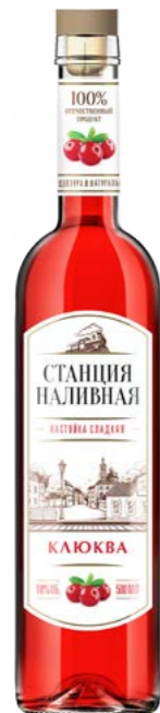
КЛЮКВА / CRANBERRIES 0,5 L / 18%

Here you can try a collection of natural flavors of sweet and semi-sweet tinctures based on selected grain alcohol «Lux».