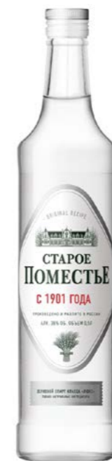
0,5 L / 38%

Alcohol «LUX» natural grain infusions and honey emphasize the authenticity of the classic origin of vodka.