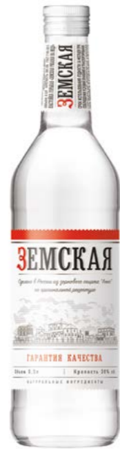
РЖАНАЯ НА МЕДУ / RYE WITH HONEY 0,25 L / 0,5 L / 38%

Made according to the national Russian recipe using grain alcohol «Lux» infusion of rye brewed bread, aromatic alcohol of rye crumbs, cumin and natural honey.