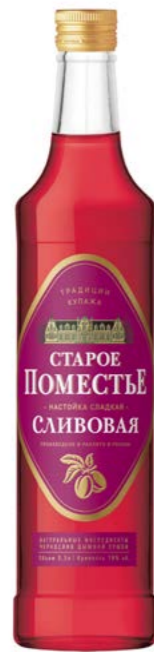
СЛИВОВАЯ / PLUM 0,5 L / 18%

Prepared according to old original recipes from grain alcohol «Lux», carefully selected natural ingredients.