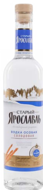
ВОДКА ОСОБАЯ / VODKA SPECIAL СОЛОДОВАЯ / MALT 0,5 L / 40%

ЧРЕЗМЕРНОЕ УПОТРЕБЛЕНИЕ АЛКОГОЛЯ ВРЕДИТ ВАШЕМУ ЗДОРОВЬЮ ЧРЕЗМЕРНОЕ УПОТРЕБЛЕНИЕ АЛКОГОЛЯ ВРЕДИТ ВАШЕМУ ЗДОРОВЬЮ