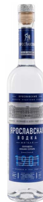
МЯГКАЯ / SOFT 0,25 L / 0,5 L / 0,7 L / 1,0 L / 40%