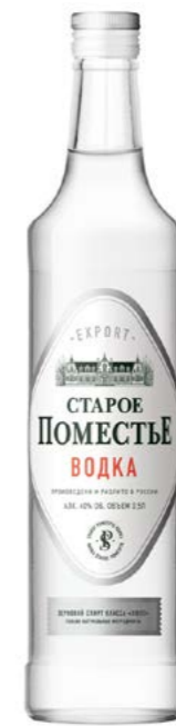
ЗЕРНОВАЯ / GRAIN 0,5 L / 40%