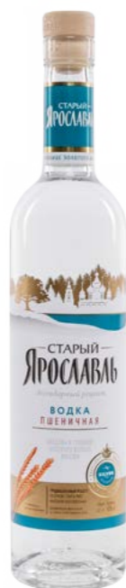
ПШЕНИЧНАЯ / WHEAT 0,5 L / 40%

Has a fresh vodka flavor and taste is soft, rounded.