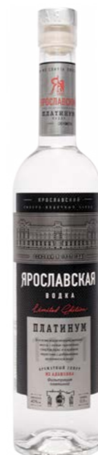
ПЛАТИНУМ / PLATINUM 0,5 L / 40%

High quality is ensured by careful filtration with silver and blending in finishing vats.