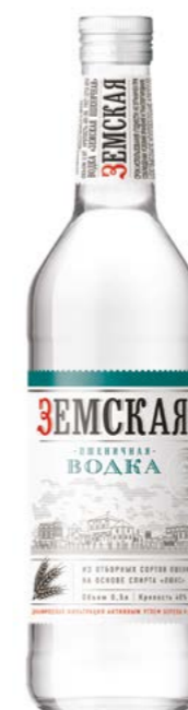
ПШЕНИЧНАЯ / WHEAT 0,25 L / 0,5 L / 40%

Control of all stages of production guarantees consistently high quality.