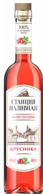
БРУСНИКА / CRANBERRIES 0,5 L / 30%

ЧРЕЗМЕРНОЕ УПОТРЕБЛЕНИЕ АЛКОГОЛЯ ВРЕДИТ ВАШЕМУ ЗДОРОВЬЮ ЧРЕЗМЕРНОЕ УПОТРЕБЛЕНИЕ АЛКОГОЛЯ ВРЕДИТ ВАШЕМУ ЗДОРОВЬЮ ЧРЕЗМЕРНОЕ УПОТРЕБЛЕНИЕ АЛКОГОЛЯ ВРЕДИТ ВАШЕМУ ЗДОРОВЬЮ