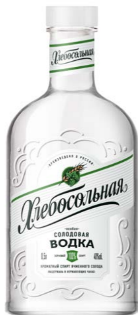
ВОДКА ОСОБАЯ / VODKA SPECIAL СОЛОДОВАЯ / MALT 0,25 L / 0,5 L / 40%

Золотая медаль. Массовый сегмент. «BEST VODKA 2021»