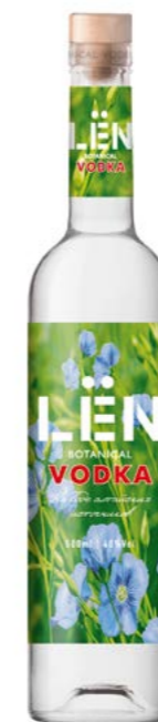
НА ВОДЕ АЛТАЙСКИХ ИСТОЧНИКОВ USING THE WATER OF ALTAI SPRINGS 0,5 L / 40%

The name and design of vodka transmit a natural origin. And the image on the inside of the bottle creates the impression of volume and realism due to the lens effect.