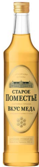
ВКУС МЕДА / TASTE OF HONEY 0,5 L / 38%