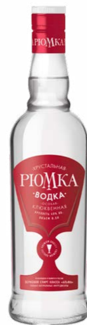
ВОДКА ОСОБАЯ / VODKA SPECIAL КЛЮКВЕННАЯ / CRANBERRY 0,5 L / 40%

ЧРЕЗМЕРНОЕ УПОТРЕБЛЕНИЕ АЛКОГОЛЯ ВРЕДИТ ВАШЕМУ ЗДОРОВЬЮ ЧРЕЗМЕРНОЕ УПОТРЕБЛЕНИЕ АЛКОГОЛЯ ВРЕДИТ ВАШЕМУ ЗДОРОВЬЮ