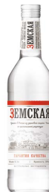
МЯГКАЯ / SOFT 0,25 L / 0,5 L / 38%