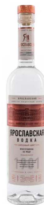
ЛИПОВЫЙ ЦВЕТ / LIME BLOSSOM 0,25 L / 0,5 L / 0,7 L / 1,0 L / 40%