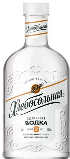
ПШЕНИЧНАЯ / WHEAT 0,25 L / 0,5 L / 40%