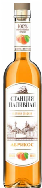
АБРИКОС / APRICOT 0,5 L / 18%