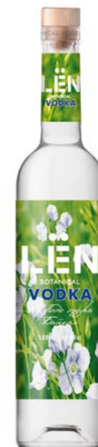
НА ВОДЕ ОЗЕРА БАЙКАЛ USING THE WATER OF LAKE BAIKAL 0,5 L / 40%