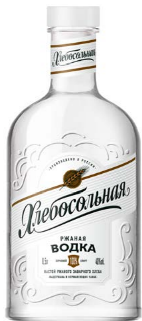
РЖАНАЯ / RYE 0,25 L / 0,5 L / 40%

A balanced combination of cereal infusions, Lux alcohol and artesian water create a rich taste of each drink.