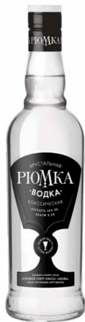
КЛАССИЧЕСКАЯ / CLASSIC 0,25 L / 0,5 L / 40%

Natural infusions make its aroma and taste brighter and softer.