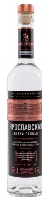
ВОДКА ОСОБАЯ / VODKA SPECIAL ХЛЕБОСОЛЬНАЯ / HLEBOSOLNAYA 0,5 L / 40%