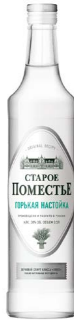
ГОРЬКАЯ / BITTER 0,5 L / 38%

ЧРЕЗМЕРНОЕ УПОТРЕБЛЕНИЕ АЛКОГОЛЯ ВРЕДИТ ВАШЕМУ ЗДОРОВЬЮ ЧРЕЗМЕРНОЕ УПОТРЕБЛЕНИЕ АЛКОГОЛЯ ВРЕДИТ ВАШЕМУ ЗДОРОВЬЮ